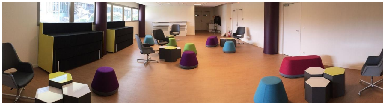
Disposition : « Formation »