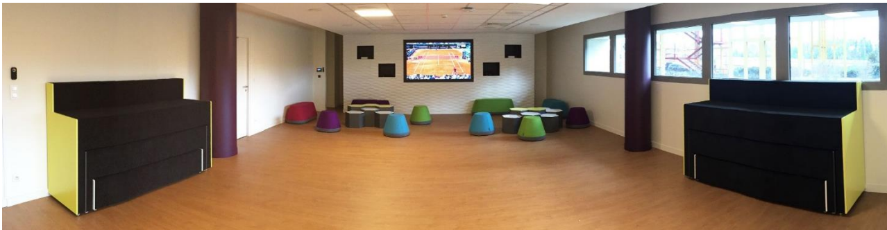
Disposition : « Événementiel »