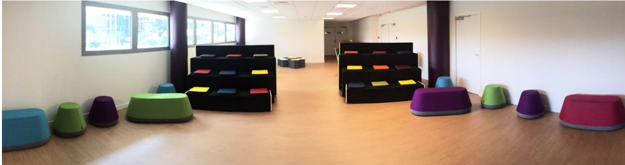
Disposition : « Projection »