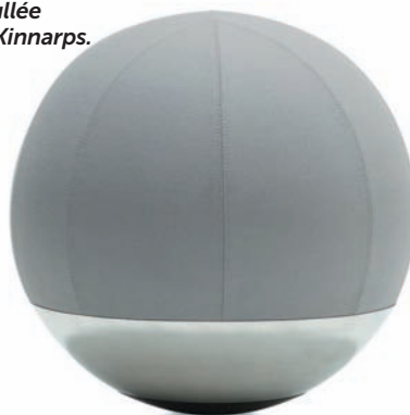
Boullée de Kinnarps.