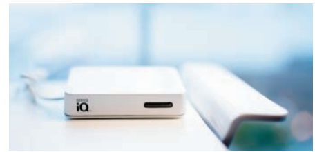
Boîtier OfficeIQ de Human Scale.

De plus, elle possède un éclairage led directement intégré dans le chant du plateau. En élevant doucement la main sur le Smart Button, la table s'illumine. La TableAir se connecte au smartphone via une application qui porte le même nom. Toutes ses fonctionnalités peuvent ainsi être contrôlées à distance.