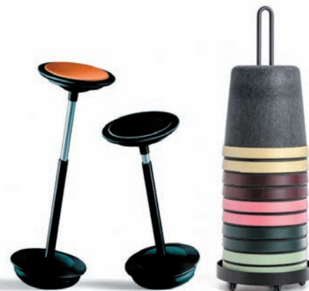
Tabouret Stitz de Martela chez Moore.