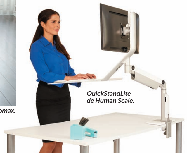
QuickStandLite de Human Scale.