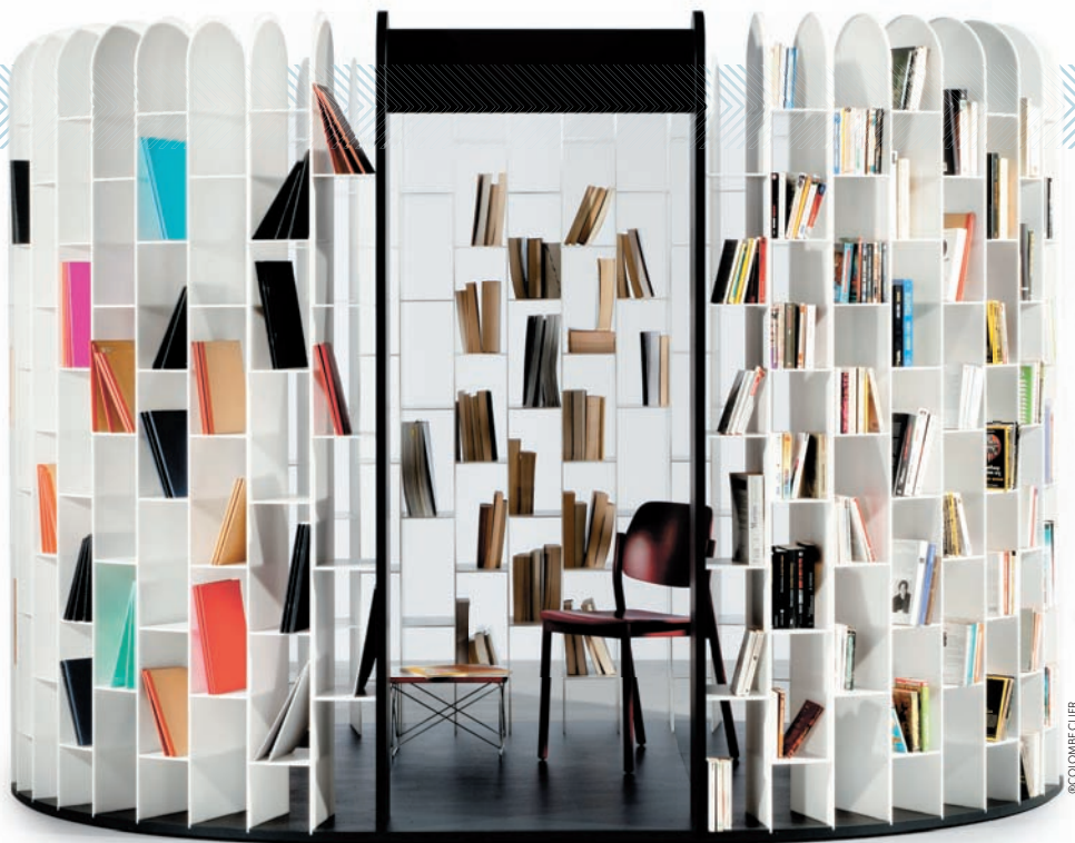
Bibliothèque modulaire Area de Gilles Belley.