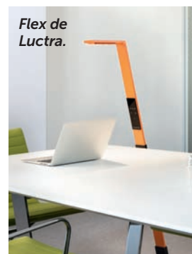
Flex de Luctra.

Chez Luctra, la lumière devient nomade. Ainsi, le fabricant propose Flex, un lampadaire mobile extrêmement léger (deux kilos). Il possède une tête pivotante et une batterie lithium-ion qui promet jusqu'à quatre heures d'autonomie. Ce lampadaire sans fil est équipé d'un système d'éclairage adapté au rythme biologique de l'utilisateur. Grâce à une sorte de grip, il se pose simplement contre un bureau, un fauteuil, etc. Dans la même veine, Luctra commercialisera en fin d'année ou début 2017 son nouveau lampadaire baptisé Floor Office. Celui-ci permet d'éclairer un à deux postes de travail. Haut de deux mètres, il possède également une grande variation de lumières (cinq niveaux) pour mieux s'adapter au bien-être des collaborateurs. ● MARIE-AMÉLIE FENOLL