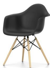
Piètement érable foncé, noir ou nuance de jaune ou en frêne ton miel