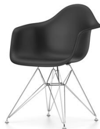
Piètement chromé ou revêtu