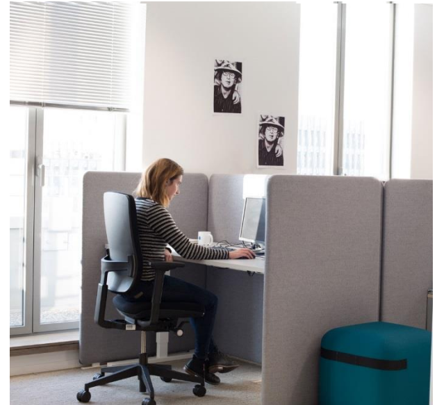
ou Assis !