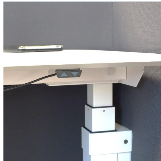
Zoom sur le système