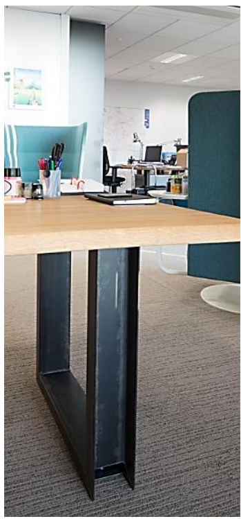
Certain le préfère industriel