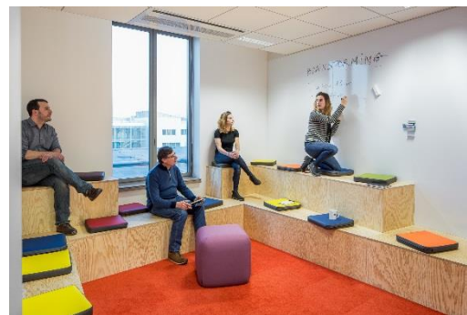
Brainstorming en cours