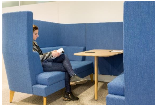
Alcôve pour réunion informelle