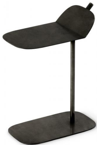
TABLE | WAM

la table Wam peut être utilisée comme support latéral d'un canapé, entre fauteuils ou bancs. En métal teinté, elle se compose de lignes originales et est caractérisé par un petit dessus "en forme d'aile" légèrement plié sur lui-même, ce qui lui donne un aspect léger, mince et dynamique.